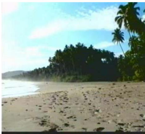
Gambar 7.1. Salah satu Pantai di Kecamatan PP. Batu Photo : April 2007-PP. Batu-Nias Selatan

Karena letaknya yang dikelilingi oleh lautan, Kabupaten Nias Selatan memiliki ekosistem-ekosistem khas wilayah pesisir yaitu ekosistem mangrove di Kecamatan Telukdalam, Kecamatan Lahusa, Kecamatan Amandraya, Kecamatan Pulau Pulau Batu dan Kecamatan Hibala, Ekosistem terumbu karang di Kecamatan Hibala, Kecamatan Pulau Pulau Batu, dan Kecamatan Lolowau, ekosistem padanglamun dan esturia di Kecamatan Telukdalam, Kecamatan Lahusa, Kecamatan Amandraya, Kecamatan Lolowau, Hibala dan Kecamatan Pulau pulau Batu yang merupakan ekosistem yang sangat produktif, tetapi juga sangat peka terhadap perubahan ekologis seperti pencemaran, sedimentasi dan bentuk bentuk perusakan lingkungan lainnya.