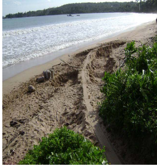
Gambar 2.10. Abrasi Pantai Photo : September 2007, Kecamatan Telukdalam-Nias Selatan