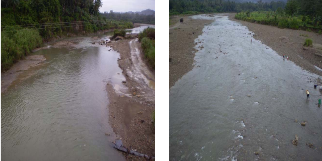
Gambar 2..12. Sungai yang Melebar akibat Penggalian BGGC. Photo : Oktober 2007, Kecamatan Telukdalam-Nias Selatan

Kondisi ini sangat dilematis dimana disatu sisi pembangunan pasca gempa bumi dan tsunami sangat dibutuhkan dan disisi lain masyarakat sangat membutuhkan perbaikan perekonomian rumah tangganya.