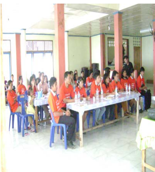
Gambar . 4.1. Kegiatan Sosialisasi dan Pelatihan Pengolahan Sampah Rumah Tangga Menjadi Kompos yang dilaksanakan oleh Kantor Pengelolaan Lingkungan Hidup Kab. Nias Selatan Bekerjasama dengan UNDP Indonesia (Nopember 2008)

Pencemaran udara juga dapat terjadi di udara tertutup (ruangan), disebabkan karena terbatasnya pergerakan udara dalam ruangan, serta adanya bahan-bahan bangunan yang beresiko mengeluarkan pencemaran udara. Studi Departemen Energi, Amerika Serikat (1987), menyebutkan bahwa pencemaran udara dalam ruangan bervariasi, tergantung pada keadaan ventilasi ruangan, serta bahan bangunan dan perabotan yang dipakai. Karpet dan perabotan yang telah tua (lama) berpotensi sebagai