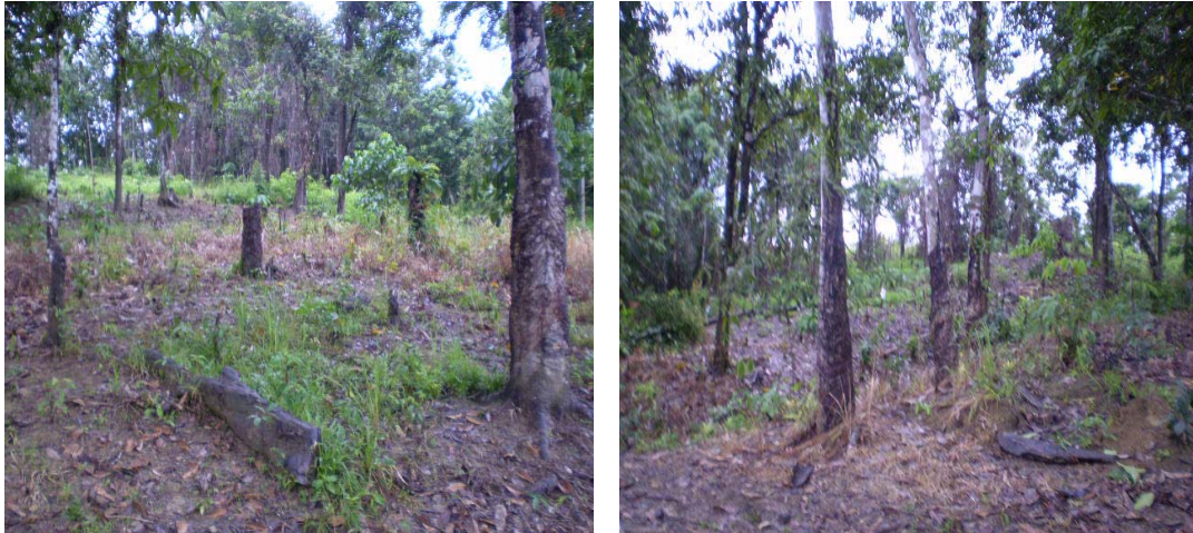
Gambar. 5.2. Kerusakan Hutan Photo : Maret 2007 Kec. Lolowau-Nias Selatan

Kerusakan hutan juga dapat memicu pemanasan global yang bukan terjadi pada peristiwa sesaat akan tetapi melalui proses yang panjang, Mengutip dari salah satu surat kabar yang memberitakan hasil analisa para ahli iklim dan cuaca PBB, maka di tahun 2007 ini iklim dan cuaca di dunia akan menjadi kacau, hal ini telah dibuktikan dengan serangkaian bencana yang terjadi di seluruh belahan bumi seperti banjir banding di Asia Selatan, badai panas di Eropa Timur, hingga salju yng pertama turun di Afrika Selatan karena naiknya suhu bumi akibat pencemaran dan perusakan lingkungan yang ada dimana hutan merupakan filternya, dan jika hutan telah rusak maka dapat dipastikan suhu bumi akan naik. Pemanasan global mempengaruhi iklim dan cuaca yang ada, iklim dan cuaca yang tidak normal akan memicu badai dan hujan yang tidak teratur seperti hujan lebat yang terjadi secara berkepanjangan dan musim kemarau yang tidak pada bulannya, hal ini jika tidak diantisipasi maka akan menimbulkan serangkaian bencana yang membuat kita merasa tidak nyaman hidup di bumi ini.