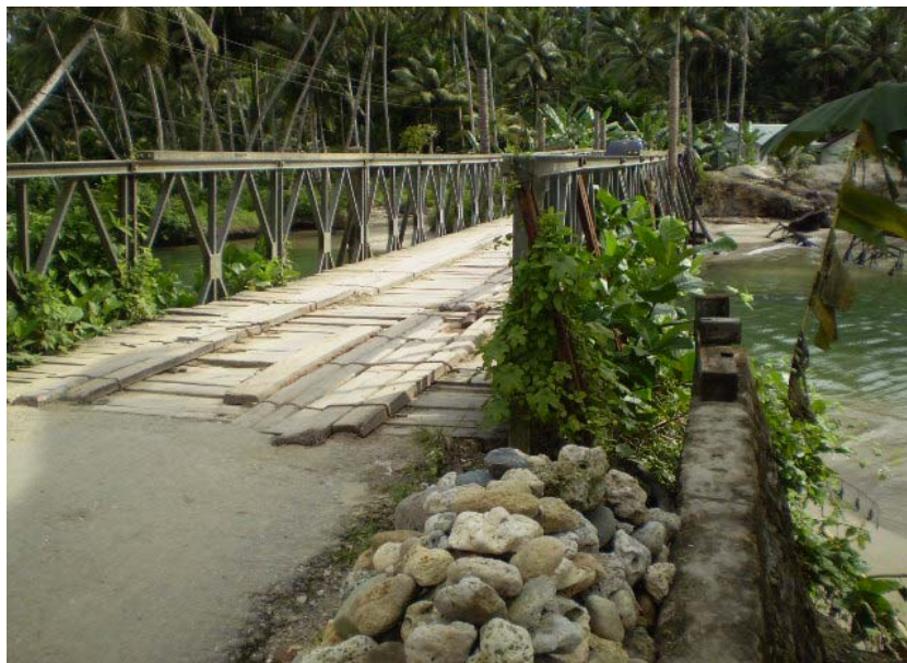
Gambar. 2.8. Jembatan yang terancam ambruk Photo : Oktober 2007, Kecamatan Telukdalam-Nias Selatan