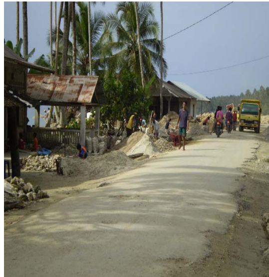
Gambar. 2.7. Menyempitnya lebar jalan Photo : Oktober 2007, Kecamatan Telukdalam-Nias Selatan