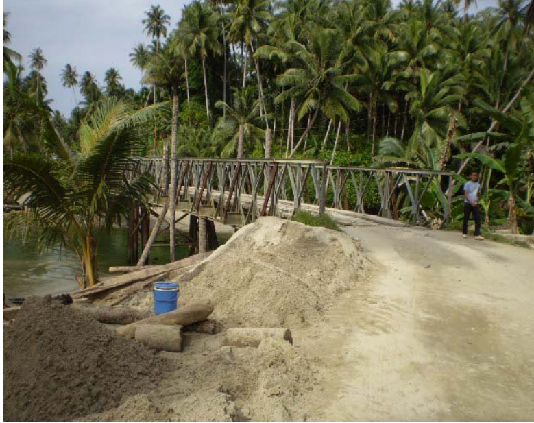
Gambar .2.4. Kegiatan Penambangan Pasir Sungai Photo : Oktober 2007, Kecamatan Telukdalam-Nias Selatan