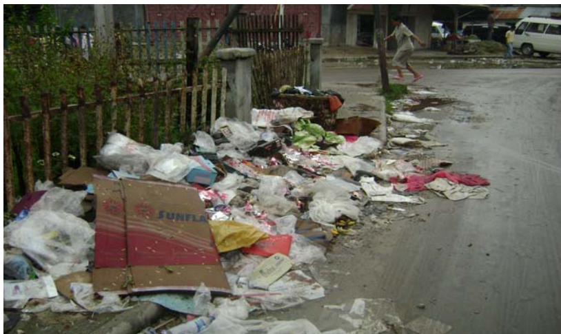
Gambar. 2.11. Banjir Sampah di kota Telukdalam (Oktober 2008)