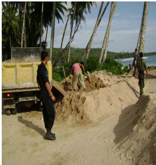
Gambar 2.9. Penertiban yang dilakukan oleh Petugas Satpol PP Photo : Oktober 2008, Kecamatan Telukdalam-Nias Selatan