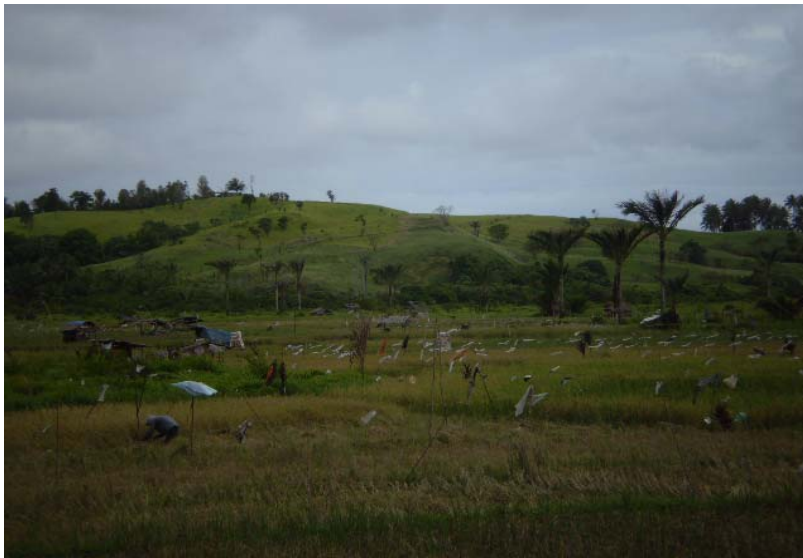
Gambar 5.1. Alih Fungsi Hutan Menjadi Lahan Pertanian Rakyat Photo : Mei 2007, Kec. Telukdalam-Nias Sealatan

Belum ada data yang pasti berapa besar kerusakan yang terjadi, yang pasti akibat tuntutan akan pembangunan dan kebutuhan dalam rekonstruksi yang saat ini sedang berjalan kerusakan hutan tidak dapat dihindari, dahulunya penebangan hutan memang ada tetapi terbatas tidak secara massal melainkan untuk kepentingan masyarakat. Hampir semua masyarakat berprofesi sebagai penjual kayu hutan yang sangat sulit untuk dilarang ataupun diminimalisir karena lahan yang mereka olah adalah lahan pribadi atau milik masyarakat (Hutan Rakyat) sedangkan Perda tentang pelarangan tersebut belum ada. Adapun jenis kayu yang di butuhkan untuk kegiatan Rehabilitasi dan Rekonstruksi adalah Kayu Durian, Kayu Simalambuo, Kayu Rii-rii, Kayu Kale Kale dan lainnya.