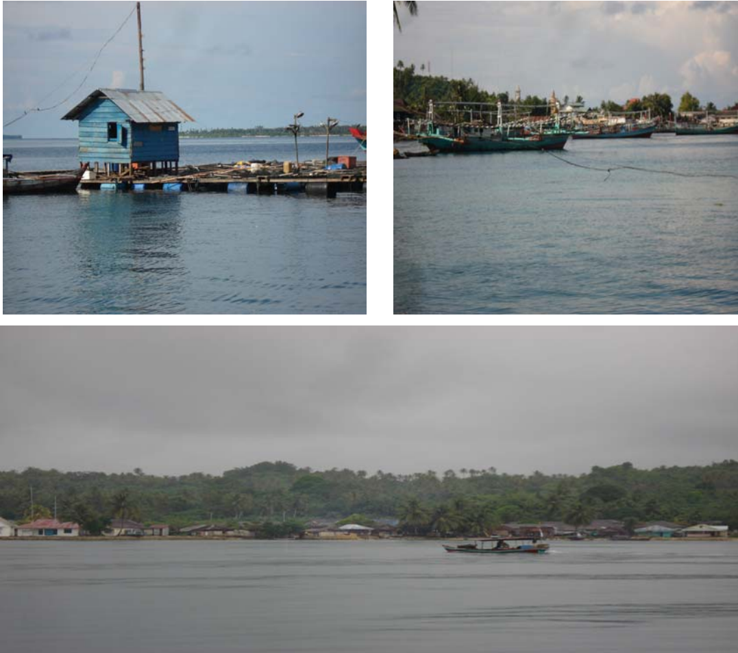
Gambar 7.3. Kapal-Kapal Ikan dan Tambak yang ada di Kec. PP. Batu