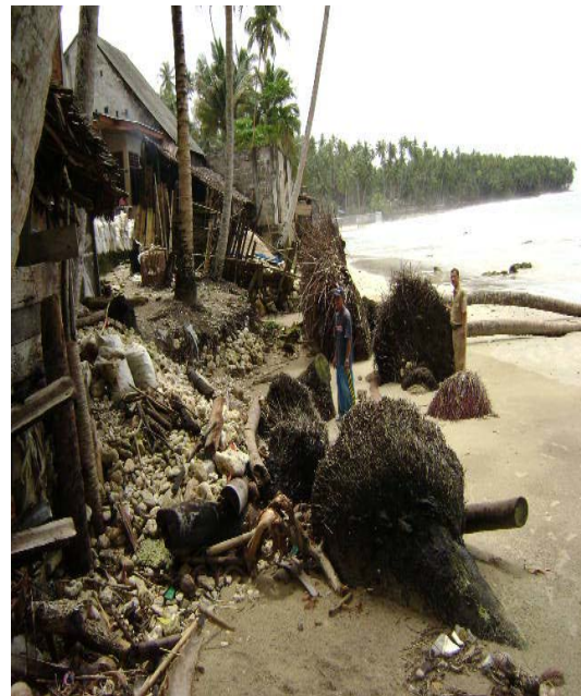
Gambar 2.11. Abrasi Pantai Photo : September 2007, Kecamatan Telukdalam-Nias Selatan