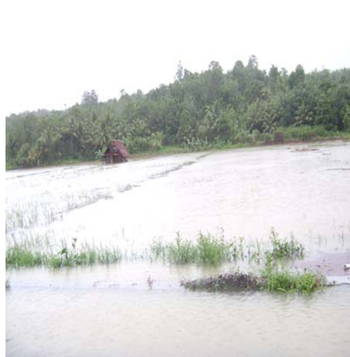
Gambar 3.3. Banjir (Nopember 2008)