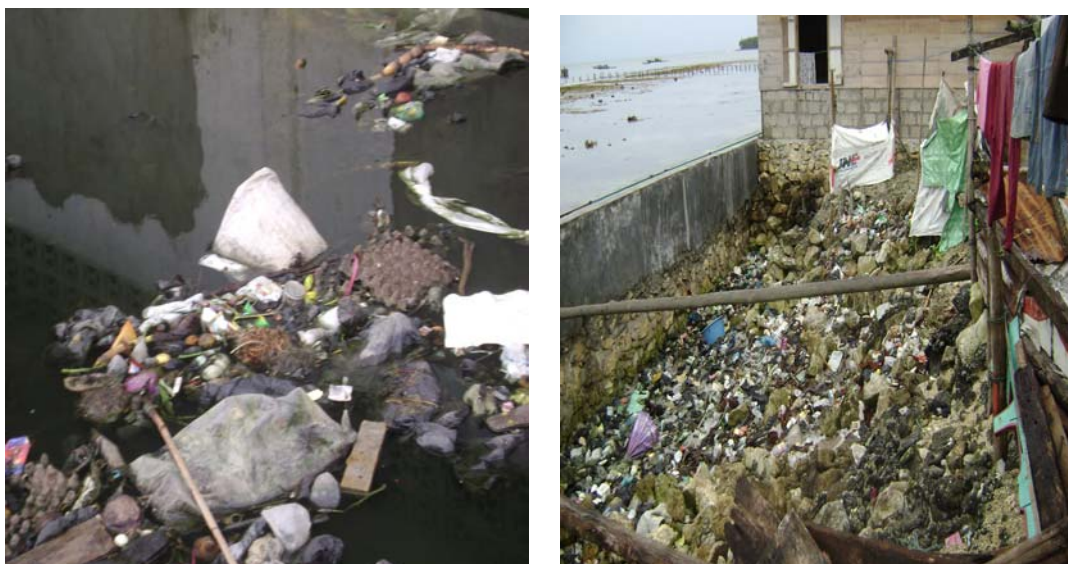
Gambar 7.3. Pencemaran Pantai oleh Limbah Domestik Foto : September 2007, Kecamatan Telukdalam-Nias Selatan

Pengelolaan Industri kepariwisataan kelautan yang tidak diimbangi oleh ketersediaan sarana dan prasarana yang memadai seperti keterbatasan informasi kelautan, fasilitas umum, dan pelayanan masyarakat setempat juga dapat menimbulkan pencemaran laut dan daerah pesisir hal ini tidak dapat di pungkiri karena setiap manusia akan selalu menghasilkan limbah dan jika limbah ini tidak dikelola dengan baik maka akan mengganggu kelestarian lingkungan pesisir dan laut, Kabupaten Nias Selatan merupakan Daerah Pariwisata Kelautan yang sudah dikenal di dalam negeri maupun di dunia internasional. Hal ini merupakan tantangan bagaimana pengelolaannya disamping dapat menambah PAD juga dapat melindungi kelestarian lingkungan hidup.