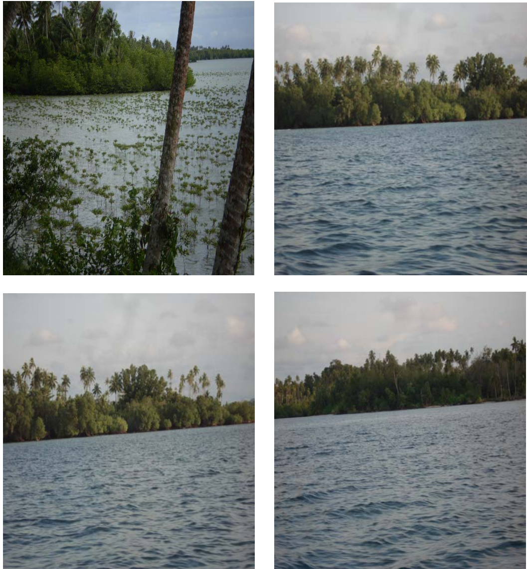
Gambar 7.2. Rehabilitasi Hutan Mangrove Photo : Oktober 2007, Kecamatan Telukdalam-Nias Selatan

Hingga sekarang belum ada catatan resmi yang dapat dijadikan acuan berapa luas ekosistem hutan mangrove yang rusak apalagi setelah terjadinya Tsunami dan Gempa Bumi namun diperkirakan sangat luas, disamping beberapa yang telah dialih fungsikan menjadi tambak, dan sementara itu penebangan hutan oleh penduduk yang akan membawa sediment tanah yang terhanyut oleh aliran sungai yang menuju ke laut terus juga. Kegiatan pembangunan dilaut seperti pencemaran minyak dari atas kapal kapal yang melintas di lautan Kabupaten Nias Selatan dan pembuangan