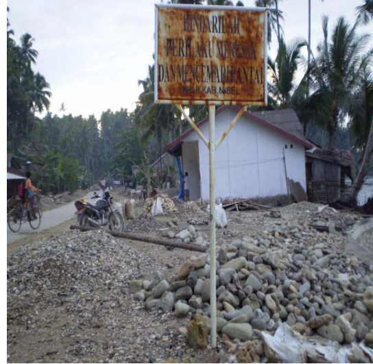
Gambar 2.6. Tembok Penahan Ombak dan Gelombang Laut yang Terancam Hancur Photo : Oktober 2007, Kecamatan Telukdalam-Nias Selatan