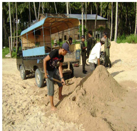
Gambar 2.2. Abrasi Pantai Akibat Penambangan Liar (Oktober 2008)