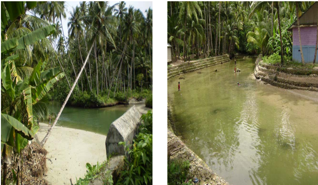
Gamabar 3.1. Air Sungai Yang Jernih Photo : September 2008, Sungai Masio, Kec. Lahusa-Nias Selatan

Proses terjadinya air di bumi ini merupakan suatu siklus, hujan yang jatuh kebumi sebagian akan menguap kembali menjadi air di udara, sebagian masuk ke dalam tanah, sebagian lagi mengalir ke permukaan. Air yang mengalir ke permukaan akan mengalir dari tempat yang lebih tinggi ke tempat yang lebih rendah dan membentuk sungai yang kemudian akan mengalir menuju ke laut, air ini akan mengalami penguapan akibat panas matahari membentuk awan di udara dan jika awan ini telah penuh dengan uap-uap air hasil penguapan maka akan terjadi hujan dan demikian seterusnya.