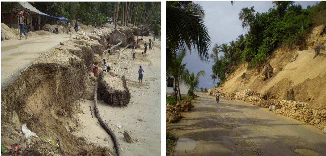
Gambar. 2.5. Badan jalan yang terkena longsor Photo : Oktober 2007, Kecamatan Telukdalam-Nias Selatan