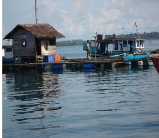
Gambar 7.2. Hasil Laut yang dituai Photo : April 2007, Kecamatan PP. Batu Nias Selatan

Selain kegiatan kegiatan tersebut, pencemaran laut juga menimbulkan masalah bagi pelestarian sumber daya laut. Masuknya berbagai jenis bahan pencemar secara langsung, misalnya buangan kapal kapal (aktifitas pelayaran), pembuangan limbah rumah tangga (domestik), adanya dumping limbah industri, pertambangan dan energi akan dapat terakumulasi dalam tubuh organisme dan melalui rantai makanan jumlahnya akan berlipat sehingga dapat mencapai taraf yang membahayakan kesehatan. Limbah juga dapat berasal dari daratan yang masuk ke perairan laut melalui sungai, misalnya buangan rumah tangga, pestisida, deterjen, sampah plastik, botol dan lain-lain. Limbah semacam inilah yang merupakan penyumbang pencemaran laut yang terbesar.