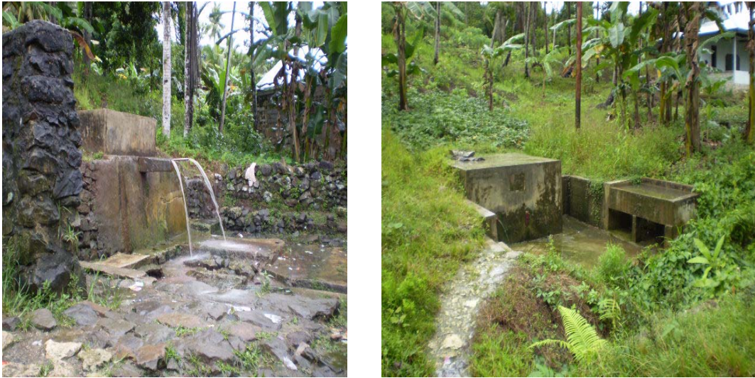
Gambar 3.2. Salah Satu Tempat MCK ( Hele-Red ) Photo : Oktober 2007, Kecamatan Telukdalam Nias Sselatan

Pemerintah Kabupaten Nias Selatan dalam menyikapi hal ini telah melakukan usaha-usaha perbaikan kualitas air dengan berbagai cara yaitu membangun tempat penampungan air di setiap desa untuk keperluan mandi, cuci dan memasak dan sekaligus membuat MCKnya, juga baru-baru ini telah diadakan kerjasama dengan pemerintah Belanda dalam hal ini perbaikan dan penggantian pompa PDAM dan pemasangan instalasi air bersih ke rumah penduduk yang hancur akibat gempa dan tsunami sehingga kapasitas produksi air bersih meningkat dan distribusinya juga ikut meningkat.