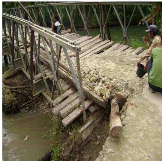
Gambar 2.1. Jembatan Sawa (Oktober 2008)