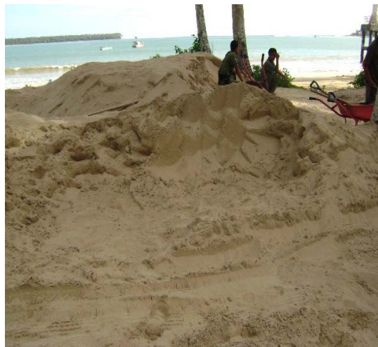
Gambar. 2.3. Kegiatan Penambangan Pasir Laut Photo : Oktober 2007, Kecamatan Telukdalam-Nias Selatan