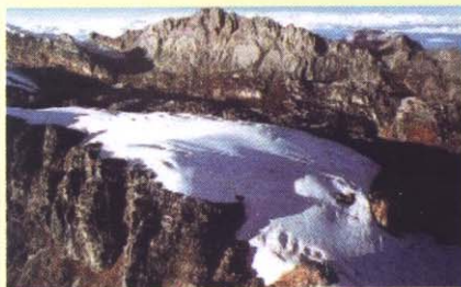
Taman Nasional Lorentz, Papua