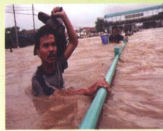
Banjir Jakarta, 2007

Rencana Aksi Nasional Mitigasi dan Adaptasi dalam Menghadapi Perubahan Iklim (RAN-PeI) diterbitkan pada Bulan November 2007 menjelang penyelenggaraan Pertemuan Para Pihak Konvensi Perubahan Iklim ke-13 di Bali pada tanggal 3-15 Desember 2007.