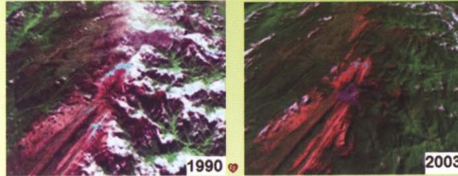
Puncak Jayawijaya, Papua